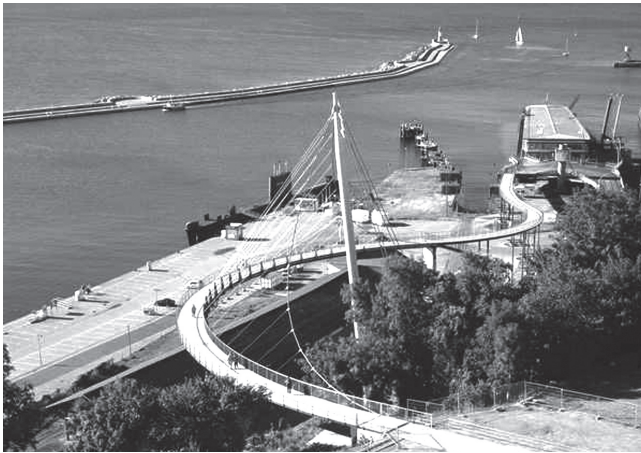
Preisträger in der Kategorie „Fußgänger- und Radwegbrücken“: die Fußgängerbrücke im Stadthafen Sassnitz.