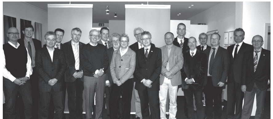
14 Dekane der NRW-Hochschulen waren zu Gast in der Kammer.

Über das detaillierte Programm der Tagung werden wir Sie rechtzeitig im Kammer-Spiegel und auf der Internetseite der Ingenieurkammer-Bau NRW informieren. www.ikbaunrw.de