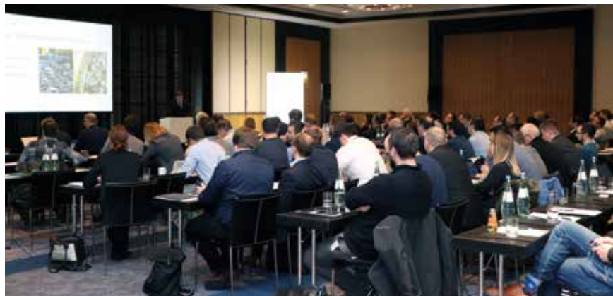
Rund 100 Gäste bei der Fire Safety Engineering 2020.