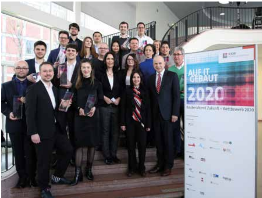
Die Preisträgerinnen und Preisträger aus allen vier Wettbewerbsbereichen mit den prominenten Förderern.

Dipl.-Kfm. Eric Hausherr Tel.: 0211 / 13067-111 hausherr@ikbaunrw.de Evelina Spangel, M. A. Tel. 0211 / 130 67-123 spangel@ikbaunrw.de